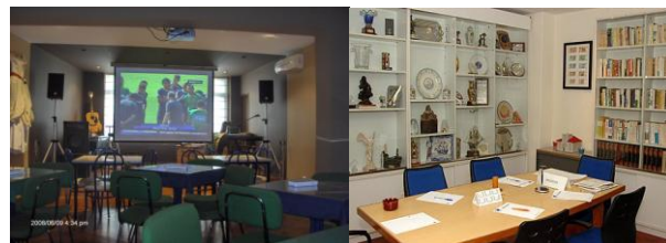
Espaço Marconiano e sala de reuniões da Direcção