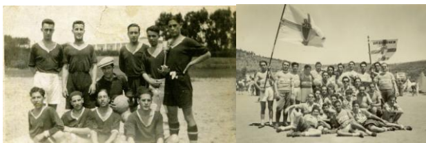
Talvez a 1ª equipa de futebol e uma concentração de atletas