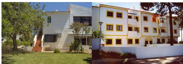
O CCDRM possui 10 apartamentos e uma suite