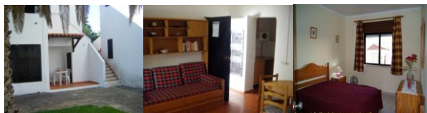
Apartamentos de Pedras e Armação