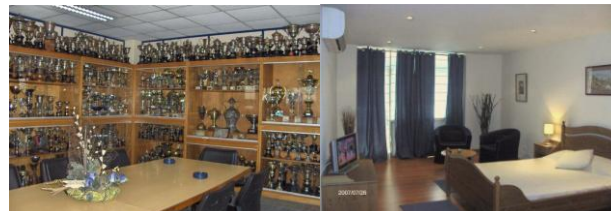
Sala de troféus