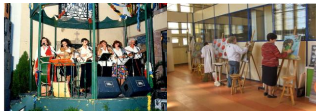
O Grupo Etnográfico e a Escola de Pintura